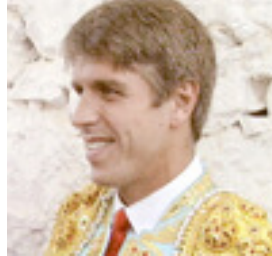
Manuel Díaz González "El Cordobés"

Tomó la alternativa en Sevilla el 11 de abril del 93 con Curro Romero de padrino y Espartaco de testigo (casi nadie al aparato) y la confirma el 20 de mayo de ese año resultando herido grave.