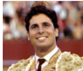
Francisco Rivera Ordoñez "Paquirri"

Tomó la alternativa en Sevilla el 11 de abril del 93 con Curro Romero de padrino y Espartaco de testigo (casi nadie al aparato) y la confirma el 20 de mayo de ese año resultando herido grave.