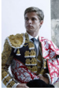
Julián López Escobar "El juli"

El 18 de septiembre de 1998 El Juli comenzó su carrera de torero en Nimes, Francia. José Mari Manzanares le dio la alternativa y José Ortega Cano fue testigo de ello. La corrida fue emitida por Televisión Española y El Juli salió a hombros tras cortar dos orejas.