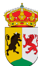
Ayuntamiento de Toro

Promovido por la Asociación Cultural “Foro Taurino de Zamora” ante la necesidad de dar proyección a nuevos valores para el mundo taurino, y atendiendo al buen número de jóvenes que desean tener una oportunidad pública, por medio de la celebración del “II Bolsín Taurino Tierras de Zamora” los distintos ayuntamientos y entidades organizadoras y colaboradoras, se suman al fomento y la promoción de la Fiesta de los Toros tratando a la vez de dar a conocer y promocionar las distintas localidades y comarcas de Zamora contribuyendo al mismo tiempo, al celebrarse todos los festejos a puertas abiertas y con entrada gratuita, al fomento de la afición al mundo de los toros, tan arraigada en toda la provincia.