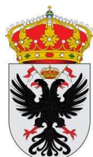
Ayuntamiento de Fuentesauco